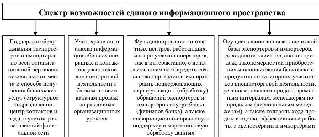
Рис 1. Возможности единого информационного пространства

В обоих случаях неотъемлемой частью CRM является, по нашему мнению, формирование единой точки зрения на клиента – участника ВЭД. Это требует создания единого информационного пространства по работе с экспортёрами и импортёрами для интеграции с другими элементами клиентоориентированной системы. Оно необходимо для поддержки продаж по всем каналам взаимодействия с корпоративными клиентами, анализа маркетинговой информации на основе имеющихся источников, а также для организации сбора, хранения и обработки информации о клиентах банка. Возможности, предоставляемые единым информационным пространством, иллюстрируются на рис. 1.