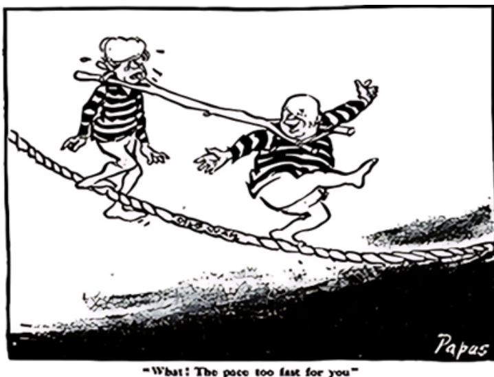
Рисунок 2. Карикатура «What! The pace too fast for you» Picture 2. Cartoon entitled 'What! The pace too fast for you'

8 ноября, уже после разрешения конфликта, на первой полосе The Guardian появилась карикатура, иллюстрирующая значение выигрыша США в Карибском кризисе для укрепления положения президента внутри страны. По мнению автора, Кеннеди «вышел сухим из воды», обыграв в геополитической схватке Фиделя Кастро и Никиту Хрущёва (см. рис. 3) 8 .