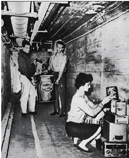
Рисунок 1. Фотография американских студентов, которые готовятся к ядерной войне

Характерным для освещения ситуации вокруг Кубы в The Guardian было осмысление кризисных событий с помощью карикатур: с октября по декабрь 1962 г. газета опубликовала восемь единиц такого контента (8%). Карикатуры были выполнены известным британским политическим карикатуристом Уильямом Папасом, работавшим в The Guardian с 1959 г. Папас специализировался на таких темах, как гонка ядерных вооружений, социальные волнения, военные столкновения в разных точках планеты. На одной из первых карикатур, появившейся в выпуске газеты от 24 октября, лидер СССР представлен как инициатор кризиса: именно он, идущий по канату первым, тянет следующего за ним президента США в пропасть. Эта карикатура сопровождала материал об отклике американцев на заявление президента Кеннеди о введении военно-морской блокады Кубы (см. рис. 2) 7 .