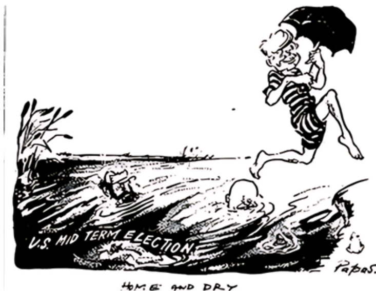
Рисунок 3. Карикатура «Home and dry» Picture 3. Cartoon entitled 'Home and dry'

Чаще всего о ситуации вокруг Кубы читателям изданий сообщали собственные корреспонденты за рубежом, причём большинство из них освещали ситуацию, находясь в США. Количество материалов от корреспондентов из СССР было незначительным. Среди представителей изданий в других странах, которые внесли свой вклад в освещение Карибского кризиса, были корреспонденты